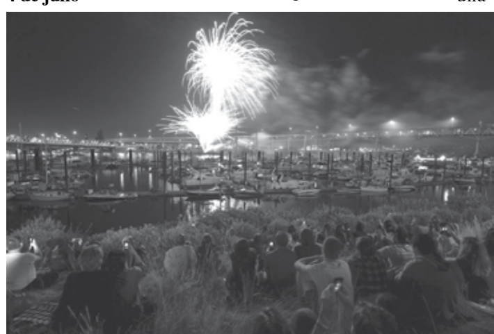
La gente de Portland se entretiene mirando los fuegos artificiales que la ciudad ofrece cada 4 de julio a las orillas del río Willamette.

Los estadounidenses celebran el 4 de julio de diferentes formas, según la parte del país donde residen. En Oregon las escapadas a las playas pacíficas, las zonas de interior, un buen picnic o asado a base de hamburguesas, costillares o hot dogs, en Texas adoran una jornada de rodeo mientras los festivales de jazz invaden Kentucky y la declaración de Independencia es leída, en directo, en el ayuntamiento de Boston; cada lugar adapta la celebración a su particular visión.