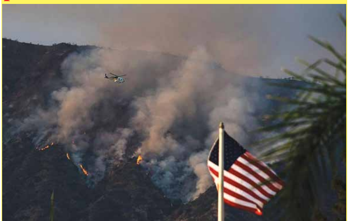
El incendio que más ha crecido en las últimas horas es el de San Gabriel, muy cerca de Los Ángeles, que ha forzado a evacuar 770 hogares y ya ha quemado 2,185 hectáreas.

SAN DIEGO - Seis personas han perdido la vida, varios de ellos excursionistas, y multitud de incendios forestales se han declarado en el suroeste de EEUU, en los estados de Nuevo México, Arizona y California, a causa de una fuerte ola de calor que afecta estos días la región.