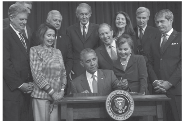
El presidente, Barack Obama, firmó el miércoles una ley que da poder a la Agencia de Protección Medioambiental (EPA) para regular los químicos tóxicos que se encuentran en miles de productos de uso diario.

En la ceremonia oficial celebrada en la Casa Blanca, Obama estuvo acompañado de congresistas demócratas y republicanos, y subrayó que esta ley es una "prueba" de que, incluso en la actual "atmósfera polarizada" en Washington debido a la campaña electoral, se pueden conseguir progresos y consenso en el Congreso.