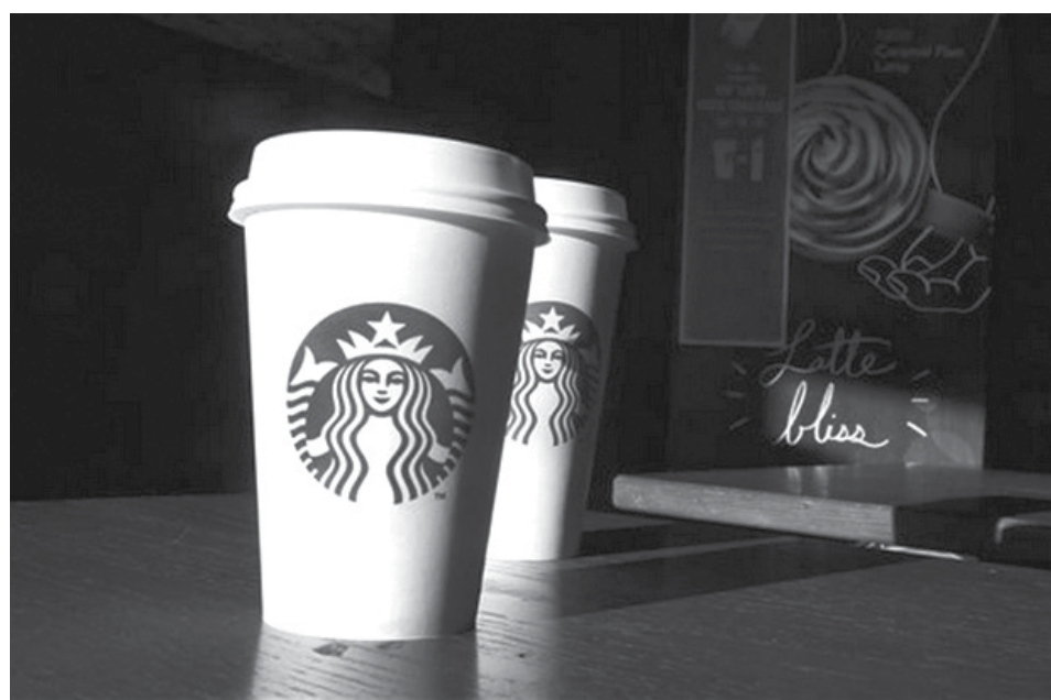
En esta foto del 17 de enero del 2014, se ven vasos de café de Starbucks en un café en Andover, Massachusetts. Un juez federal permitió que proceda una demanda que acusa a Starbucks de sistemáticamente llenar menos los envases de latte.

SAN FRANCISCO - Un juez federal permitió que proceda una demanda que acusa a Starbucks de llenar menos los vasos de su café latte.