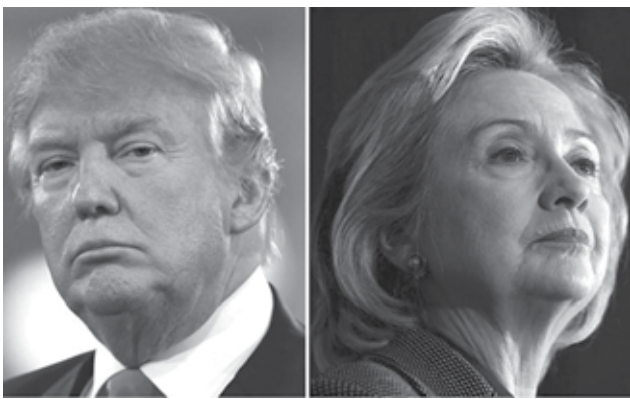
Donald Trump y Hillary Clinton.

En esta ocasión, Clinton dejó a Trump en un segundo plano y se enfocó en explicar sus propuestas económicas en Carolina del Norte, al igual