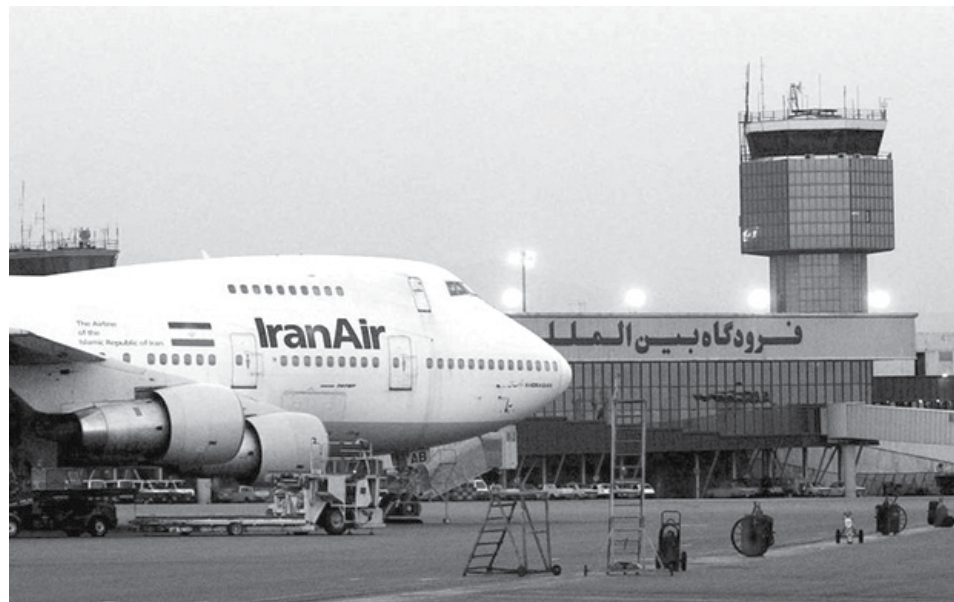
Un Boeing 747 de la aerolínea de bandera iraní en el aeropuerto internacional Mehrabad de Teherán. Boeing Co. dijo que firmó un acuerdo con Iran Air que "expresa la intención de la aerolínea" de comprar sus aviones, la primera transacción importante de la República Islámica con una empresa estadounidense después del acuerdo nuclear con las grandes potencias.

SEATTLE - Boeing Co. dijo que firmó un acuerdo con Iran Air que "expresa la intención de la aerolínea" de comprar sus aviones, la primera transacción importante de la República Islámica con una empresa estadounidense después del acuerdo nuclear con las grandes potencias.