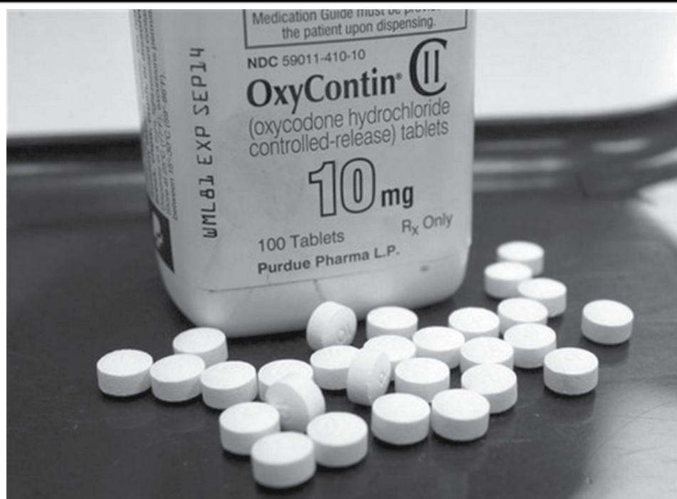
Esta foto muestra un frasco del analgésico OxyContin en una farmacia en Montpelier, Vermont. Con la epidemia de sobredosis empeorando en los Estados Unidos, casi una tercera parte de los beneficiarios de Medicare recibieron al menos una prescripción para opiáceos adictivos como OxyContin y fentanilo en el 2015.

El monto total de la venta propuesta aún no está claro. El jefe de la Organización de Aviación Civil iraní Ali Abedzadeh dijo en declaraciones publicadas el domingo por el diario estatal IRAN que la transacción es por un centenar de aviones, algo sobre lo que Boeing se ha negado a hacer declaraciones.