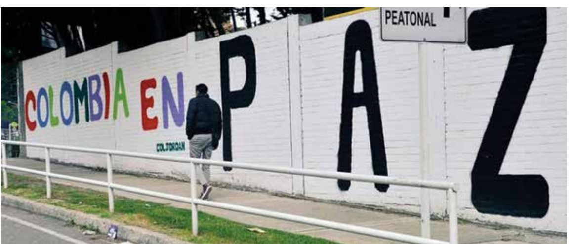
El acuerdo incluye otros aspectos fundamentales para el fin del conflicto en Colombia como la dejación de armas por parte de la guerrilla, las garantías de seguridad, lucha contra el paramilitarismo y sus redes de apoyo y la persecución de las conductas criminales.

WASHINGTON - El gobierno estadounidense dio la bienvenida al acuerdo anunciado el miércoles entre el gobierno de Colombia y las Fuerzas Armadas Revolucionarias de Colombia (FARC) para el cese al fuego bilateral y definitivo y cuyo contenido se dará a conocer este jueves en La Habana en un acto oficial.