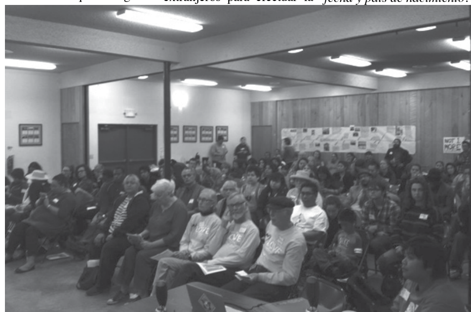
Una vista dentro del centro de detención para inmigrantes en Tacoma, en el suroeste del estado de Washington, donde un grupo de familiares esperan para ver a sus seres queridos.

Fue así como finalmente dos años después de haber declarado la independencia, se firmó el Tratado de París con el que Gran Bretaña reconocía la independencia de los Estados Unidos.