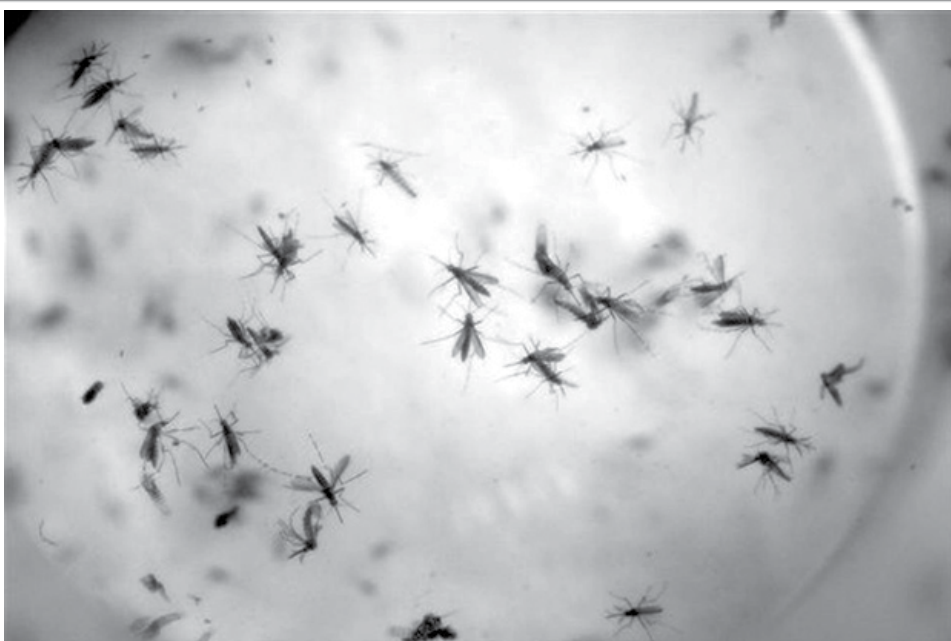
En esta foto se ven mosquitos aedes aegypti en un contenedor para mosquitos en Cúcuta, Colombia. Luego de un estancamiento de tres meses, el Senado de EEUU votó sobre un pedido del presidente Barack Obama de fondos para combatir el virus de zika.

De acuerdo con las estadísticas del Departamento de Trabajo, durante los últimos 40 años el porcentaje de trabajadores a quienes el Gobierno federal garantiza las horas extra remuneradas con base en los umbrales de sueldo se ha reducido de un 62 % que había en 1975 a un 7 % en la actualidad, "pese a que en la actualidad estas protecciones son más importantes que nunca".