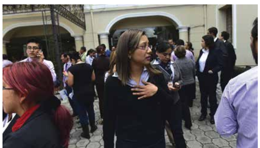
Las personas evacuaron los edificios en la ciudad de Quito.

Correa anunció que se han suspendido las clases vespertinas en todo el país "hasta recabar toda