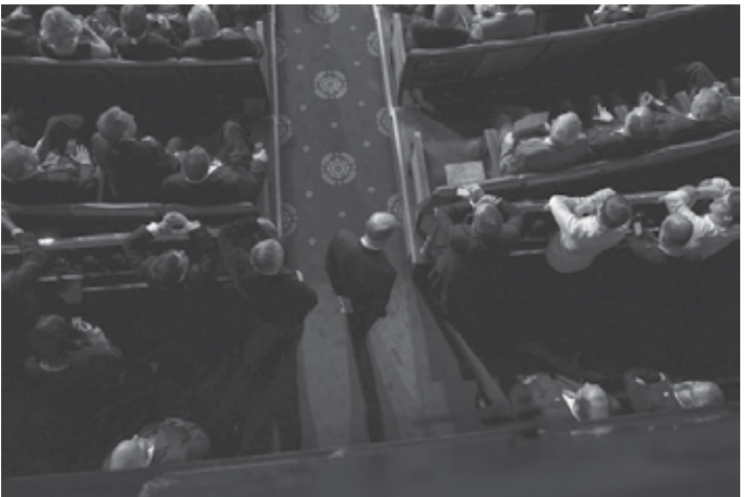
Las inversiones se concentran en los escaños más vulnerables.

NUEVA YORK - Los hermanos Charles y David Koch, unos de los más influyentes donantes conservadores de EEUU, están comenzando a dedicar millones de dólares a las elecciones de 2016 con la esperanza de evitar que el Senado caiga en manos demócratas, informó hoy el diario político The Hill. Los hermanos Charles y David han gastado ya más de 12 millones de dólares en candidatos al Senado y están cerrando contratos de publicidad televisiva por valor de 30 millones de dólares, indicó The Hill, que cita a fuentes próximas a los dos multimillonarios. Según la publicación, los hermanos Koch, propietarios de industrias químicas, no van a apoyar al oficioso candidato presidencial republicano Donald Trump y dedicarán todos sus esfuerzos a impedir que candidatos conservadores vulnerables pierdan su asiento en el Senado. Los fondos de la red de donantes dirigida por los hermanos Koch se centrará en las elecciones del Senado de noviembre en los estados de Ohio, Wisconsin, Nevada, Pensilvania y Florida. En esas contiendas hay republicanos que no concurren al puesto, como Marco Rubio en Florida, o algunos a los que las encuestas no dan un margen generoso, como Rob Portman, de Ohio, al que todos