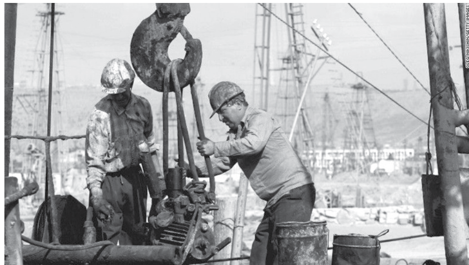
El sector energético domina la lista. La dramática caída en el precio del "oro negro" ha diezmado los ingresos —y empleos— de las compañías petroleras

WASHINGTON - Donald Trump y Bernie Sanders criticaron a la empresa Carrier por hacer recortes de empleos en Estados Unidos.