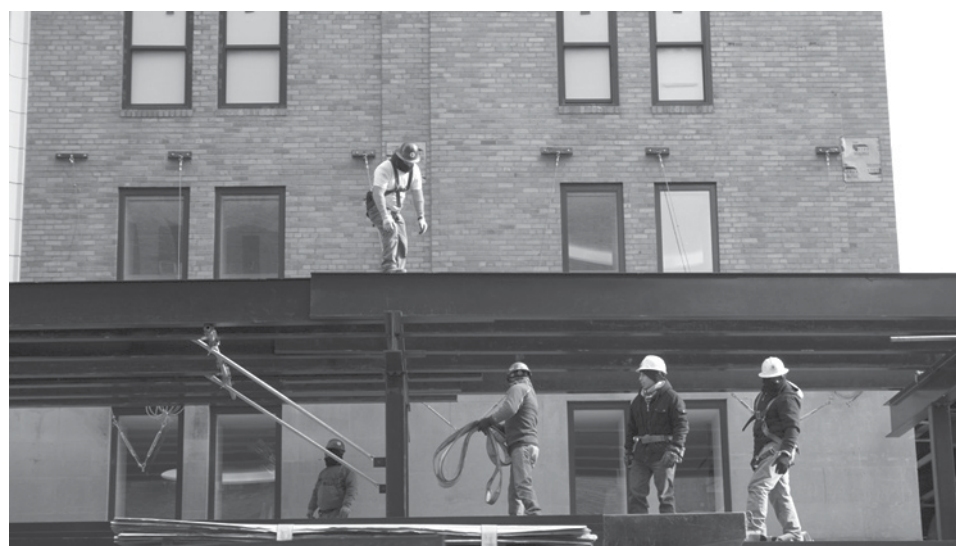
4 millones de trabajadores en todo el país podrán disponer de horas extra remuneradas

•El Departamento de Trabajo estima que otros 4.2 millones de estadounidenses pasarán a tener horas extra pagadas