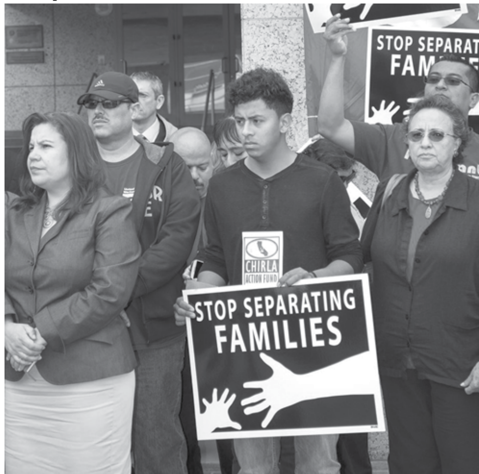
Numerosos activistas se unieron a familias centroamericanas preocupadas por las redadas.

•Activistas y centroamericanos recién llegados expresan temor por el peligro de la deportación