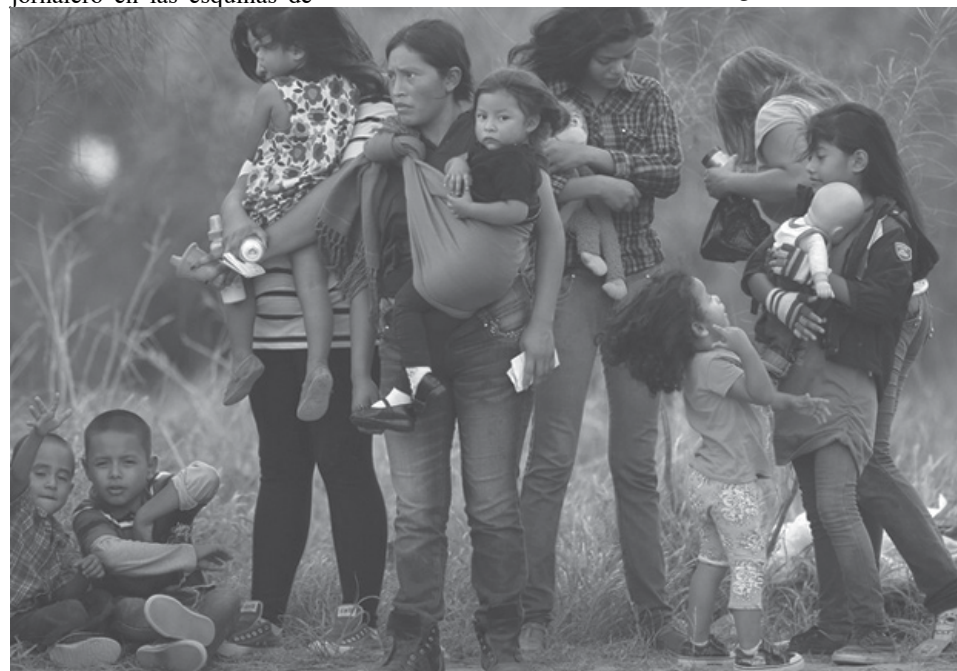
La Unión Americana de Libertades Civiles demandó al Gobierno ante un tribunal federal por la deportación de madres y niños inmigrantes que huyen de la violencia en Centroamérica.

El estudio tiene sus limitaciones. Casi tres cuartas partes de las personas que participaron eran mujeres y más de las tres cuartas partes eran blancas, por lo que es difícil de generalizar los resultados a una población más amplia. Además, fueron los propios participantes los que describieron la calidad de su estado de ánimo, el sueño y el sexo.