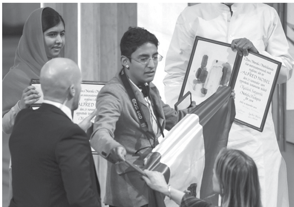
EL MEXICANO QUE OPACÓ A MALALA EN EL PREMIO NOBEL. "Por favor Malala no te olvides de México", fue la expresión del joven que cargaba con una bandera mexicana.