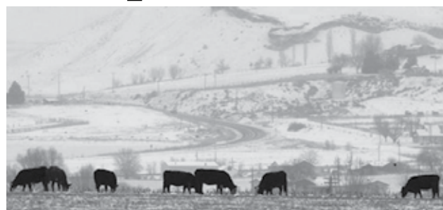
Más de 150 cabezas de ganado valoradas en unos 350.000 dólares desaparecieron en el suroeste de Idaho, y las autoridades sospechan de robo moderno de ganado ante la subida de los precios.

BOISE, Idaho, (AFP) - Más de 150 cabezas de ganado valoradas en unos 350.000 dólares han desaparecido en el suroeste de Idaho, y las autoridades sospechan que podría tratarse de robos de ganado ante el aumento de los precios de la carne de ternera.