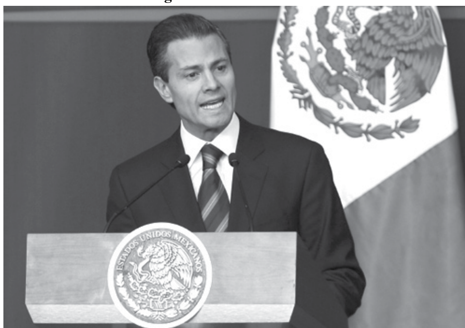
Peña Nieto hace cambios en cuerpo de cónsules.

•Presidente mexicano sugiere cuatro nuevos cónsules al Senado