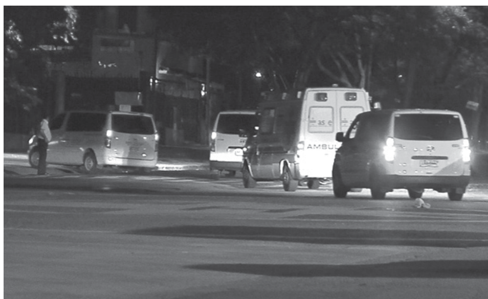
Las ambulancias en las que fueron trasladados los ex detenidos en Guantánamo, el domingo pasado.

Desde que pasó el poder a su hermano Raúl, Fidel Castro consagra buena parte de su tiempo a la escritura y a recibir a dignatarios extranjeros de paso por Cuba.