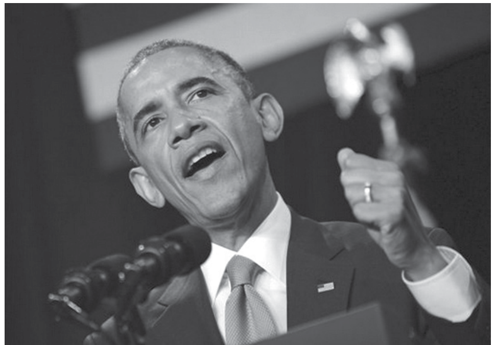
El Presidente Obama insistió en que su gobierno se cerciorará de que las familias que trabajan de manera responsable no sean "la prioridad" de las deportaciones.

Además, el presidente ruso, Vladimir Putin, obtuvo el tercer lugar de la nominación al personaje del año de Time por "el manejo de su país de los Juegos Olímpicos de Invierno en Sochi hasta la anexión de Crimea, y su papel en la lucha civil en curso en el este de Ucrania". En 2007, el mandatario ruso ya había obtenido esta calificación.