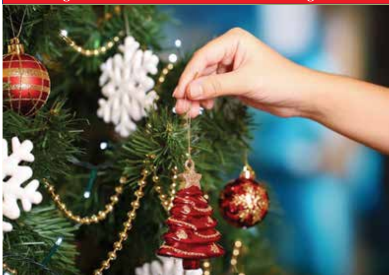
Las familias con niños, por cuestión de seguridad, escogen árboles artificiales.

Portland-Vancouver • Tigard • Beaverton • Hillsboro • Cornelius • Forest Grove • Gresham • Clackamas • Hood River • Canby Newberg • McMinnville • Woodburn • Mt. Angel • Silverton • Salem • Dallas • Independence • Monmouth • Albany • Corvallis • Springfield • Eugene