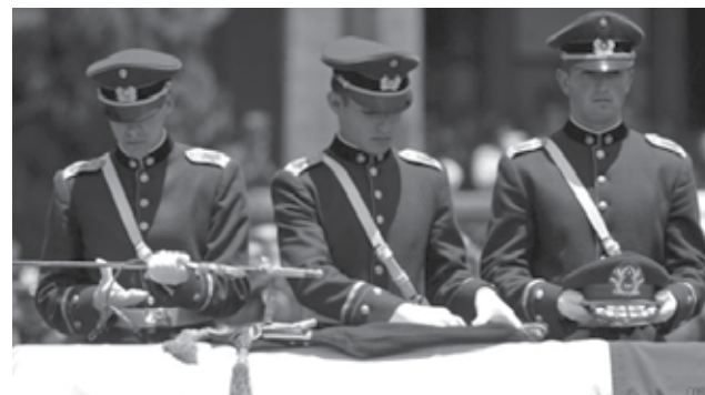
Durante el funeral del general Augusto Pinochet en el 2006, se le rindieron homenajes que desataron reacciones encontradas entre la población.

"Esta acción es inaceptable, pues estamos