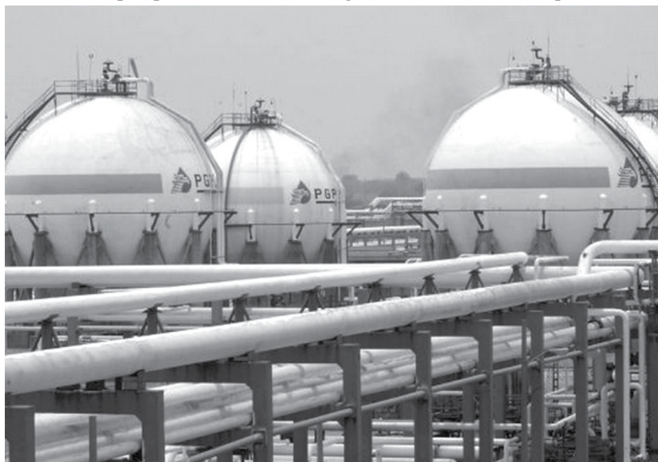
El precio de la gasolina en México es subsidiado por el gobierno, pero aún así su precio es más caro que en EEUU.

•Pese a ser un país productor, en México la gasolina es 22% más cara que en EEUU