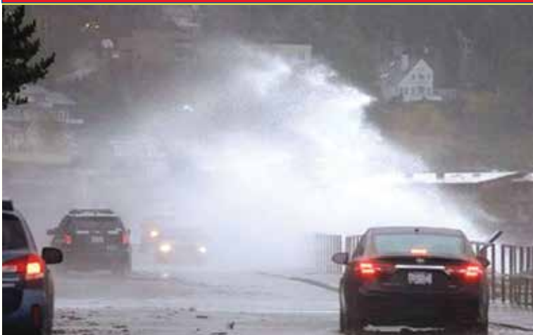
Un ventarrón impulsa una ola desde la orilla, en medio de una tormenta invernal, en una carretera en Seattle.

Portland-Vancouver • Tigard • Beaverton • Hillsboro • Cornelius • Forest Grove • Gresham • Clackamas • Hood River • Canby Newberg • McMinnville • Woodburn • Mt. Angel • Silverton • Salem • Dallas • Independence • Monmouth • Albany • Corvallis • Springfield • Eugene