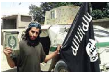
Abdelhamid Abaaoud, sospechoso de haber planeado los atentados, habría muerto en la redada que se produjo esta madrugada en la capital gala.

Entanto, el fiscal de París, François Molins, sostuvo que Abaaoud no forma parte de los ocho arrestados este miércoles en el departamento de Saint-Denis, aunque no pudo confirmar si es uno de los terroristas fallecidos en la operación, pues aún falta una persona por identificar.