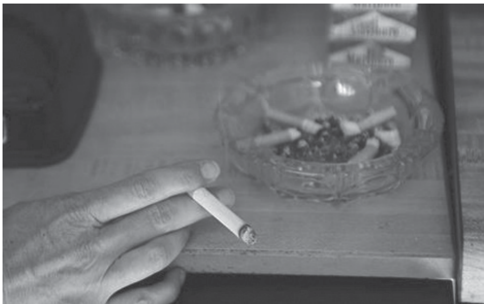
El estudio sugiere que dejar de fumar podría permitir a la corteza cerebral recuperar algo de su tamaño original, si bien son necesarios “más estudios para comprobarlo”.

Fumar acelera el proceso de envejecimiento del cerebro y puede empeorar la capacidad para tomar decisiones y resolver problemas, según un estudio publicado en la revista “Molecular Psychiatry”.