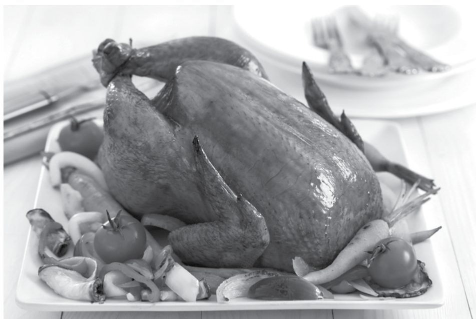
Consejos para comprar el mejor ave para tu cena de Thanksgiving.