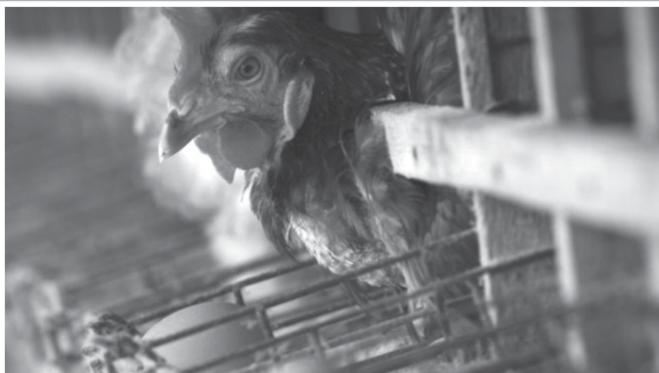
Los consumidores de EEUU exigen huevos producidos fuera de estrechas jaulas.

"No es que no queremos... es que no podemos", le dijo Marco Rubio a George Stephanopoulos de ABC. "Debido a que no hay forma de verificar antecedentes a alguien que viene de Siria".