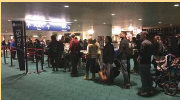
Un grupo de viajeros hacen fila para viajar en el Aeropuerto Internacional de Portland (PDX).

— Considere comprar un pase de un día a la sala de espera de la