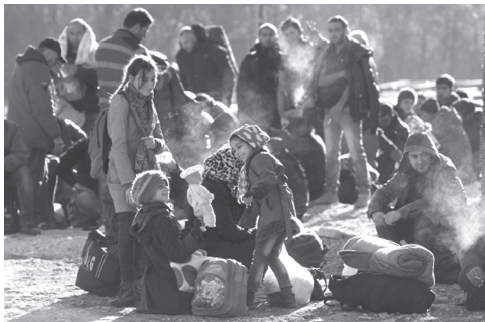
Al menos 26 estados de Estados Unidos se han negado a recibir a refugiados sirios tras los atentados en París la semana pasada.

PENSILVANIA - Una ola de gobernadores —en su mayoría republicanos— emitieron varios comunicados donde expresaban sus objeciones hacia el hecho de que refugiados sirios llegaran a sus estados luego de los ataques en París.