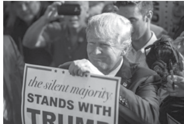
Donald Trump posa junto a sus simpatizantes en el Trump National Doral Miami resort, en Doral, Florida.

A diferencia de la mayoría de aspirantes a ser el nominado del Partido Republicano, Cruz, un favorito del ultraconservador Tea Party, ha evitado durante toda la campaña criticar directamente a Trump, e incluso apareció junto a él en una manifestación en septiembre contra el pacto nuclear con Irán.